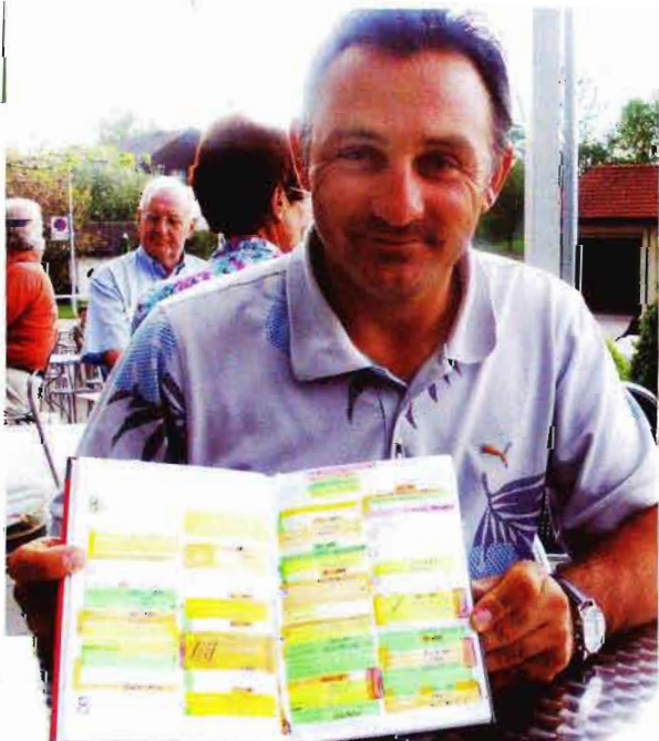
STRAFFES PROGRAMM. Die Agenda von Li Puma ist gut gefüllt.

Platzrekord bei der PGA-Meisterschaft in Losone 2002: 65 (-6)